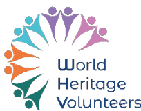
Le logo de l'Initiative de volontariat pour le patrimoine mondial

Veuillez noter que, dans un tel contexte, les organisations ne sont PAS autorisées à utiliser le logo de l'UNESCO ni le logo de Better World.